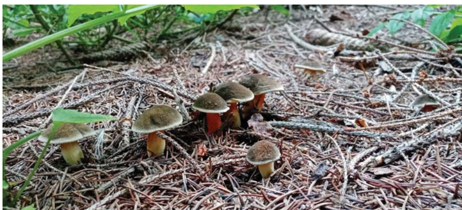
Obr. 1 Takúto krásnu scenériu nám ponúka les pri našej prechádzke, plodnice vyrastajúce z podhubia.

Až 90 % bunkových stien húb tvoria polysacharidy, pričom vo vode rozpust-