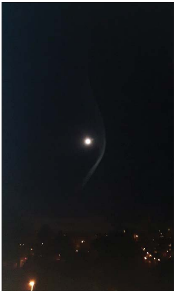
Obr. č. 1 Měsíc nad Prahou. Vznik: dne 2020-02-10, čas: 05:48:28. Náhodně pořízená fotografie z okna domu na území hlavního města Prahy krátce před vypuknutím pandemie SARS CoV-2. Poznámka: Původní snímek bez jakýchkoliv úprav.