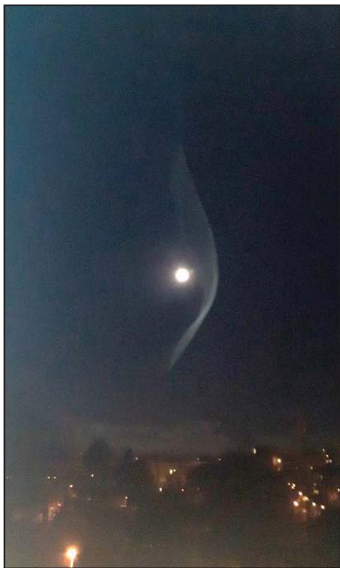
Obr. č. 2 Měsíc nad Prahou II. Vznik: dne 2020-02-10, čas: 05:48:28. Náhodně pořízená fotografie z okna domu na území hlavního města Prahy krátce před vypuknutím pandemie SARS CoV-2 (COVID 19). Poznámka: Původní snímek (viz obr. č. 1) upraven nástrojem Power Point: jas +40 %, kontrast -20 %.